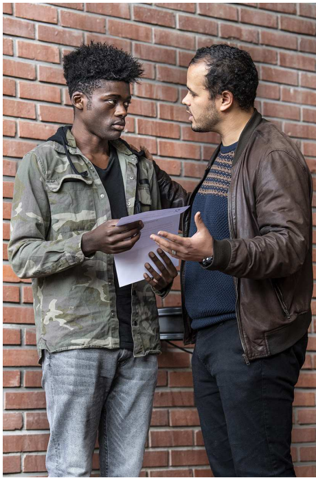
Tribunal de Bobigny