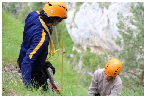
Trophée Sport Aventure 2017