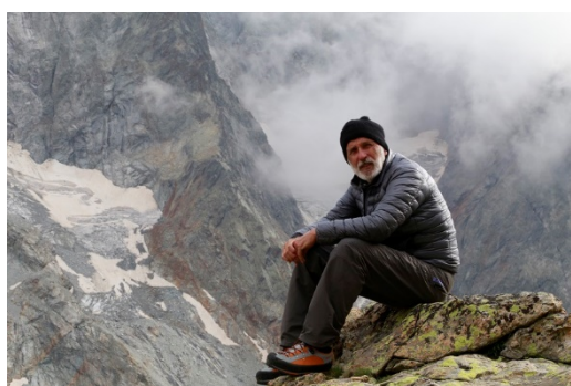
Jean-Marc Rochette

La 23ème édition du Trophée Sport sera parrainée par Jean-Marc Rochette, un célèbre auteur de bande dessinées qui se passionne depuis toujours pour la montagne. Il a accepté de parrainer l'évènement pour transmettre certains messages aux jeunes, témoignant lui-même d'une enfance difficile.