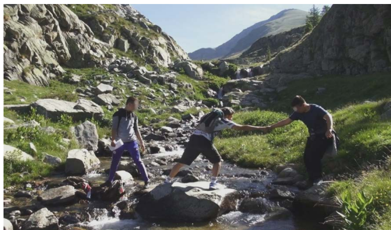
Trophée Sport Aventure 2017