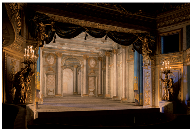
Le Théâtre de la Reine

Il fait l'objet d'une convention partenariale pluripartite impliquant, notamment, la direction interrégionale des services pénitentiaires de Paris, dans le cadre de la politique culturelle que cette dernière promeut à destination de l'ensemble des personnes incarcérées sur le territoire francilien.