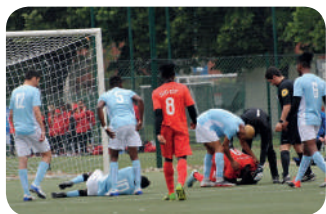
P. 2 : Retour sur le football et le basket