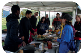
P. 3 : Les interviews du jour et le village animation