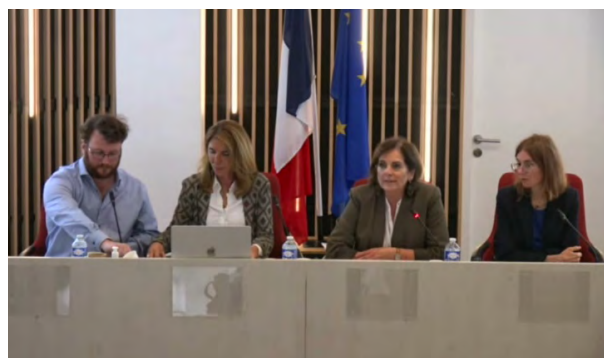
| Webinaire CNB/DACS

Enfin, la direction est intervenue dans de très nombreux colloques ou formations dédiés à l'amiable. Elle a notamment participé au rassemblement des magistrats en charge de la médiation et de la conciliation organisé par le secrétariat général, à un colloque sur les MARD de la cour d'appel de Grenoble, aux États généraux de l'amiable du Conseil national des barreaux et au colloque sur la médiation de la Caisse des dépôts et consignations.