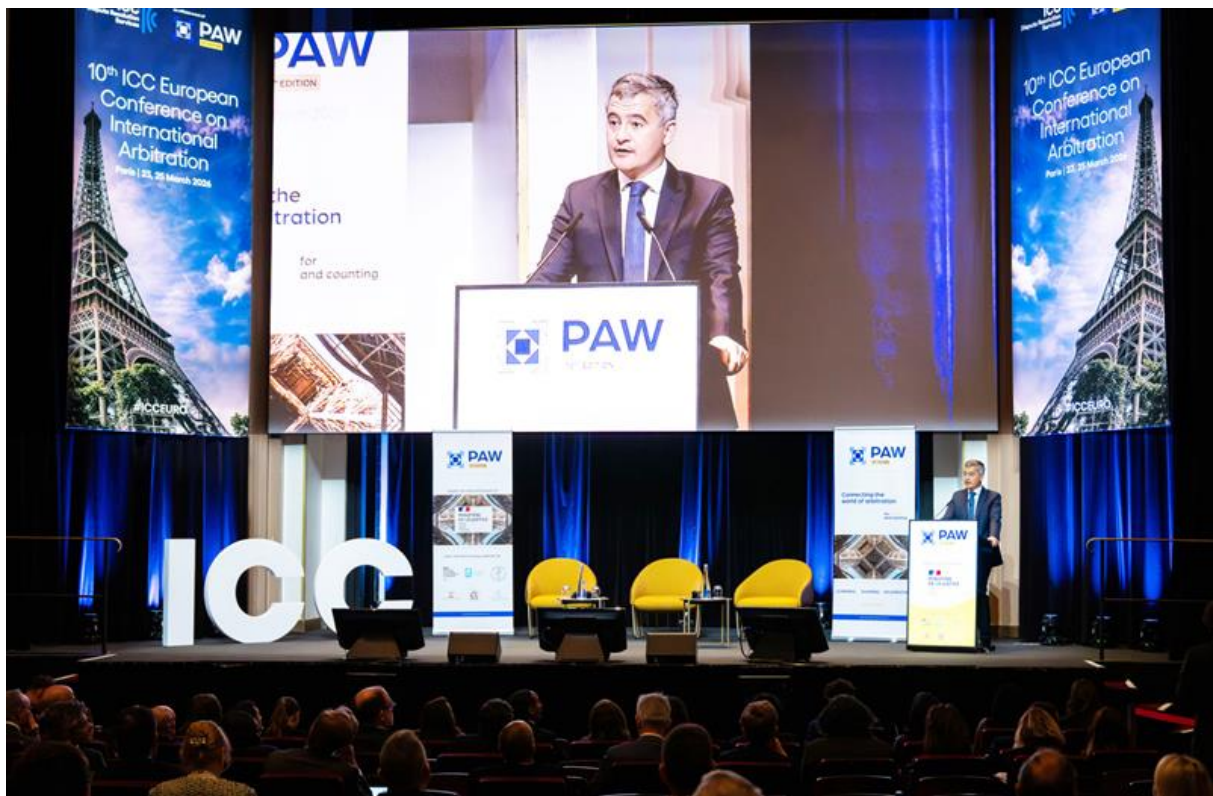
Gérald Darmanin, garde des Sceaux, ministre de la Justice, à la maison de la Chimie le 23 mars pour l'ouverture de la Paris Arbitration Week du 23 au 27 mars 2026.

Le ministère de la Justice poursuit les échanges et le travail sur la prochaine étape de la réforme dans la perspective d'une codification du droit de l'arbitrage à l'autonomie 2026.