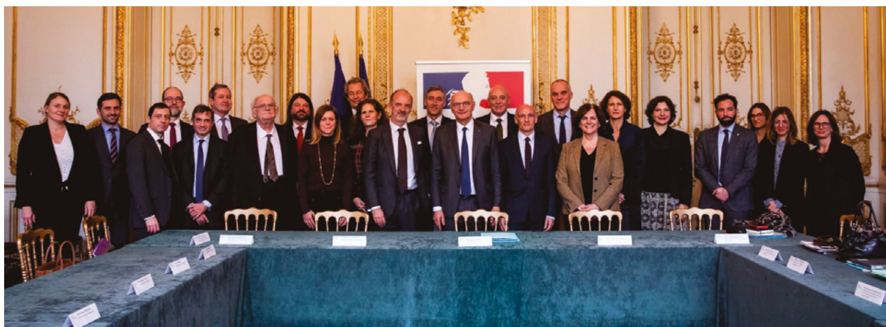
Lancement d'un groupe de travail sur le droit de l'arbitrage par Didier Migaud, garde des Sceaux, ministre de la Justice, le 12 novembre 2024.

Cette instance a eu pour mission d'évaluer l'efficacité des dispositions existantes concernant l'arbitrage interne et international, de relever le cas échéant, les difficultés ou insuffisances actuelles et d'émettre des recommandations et propositions rédactionnelles visant à y remédier ou à améliorer le dispositif existant dans un rapport rendu mi-mars 2025.