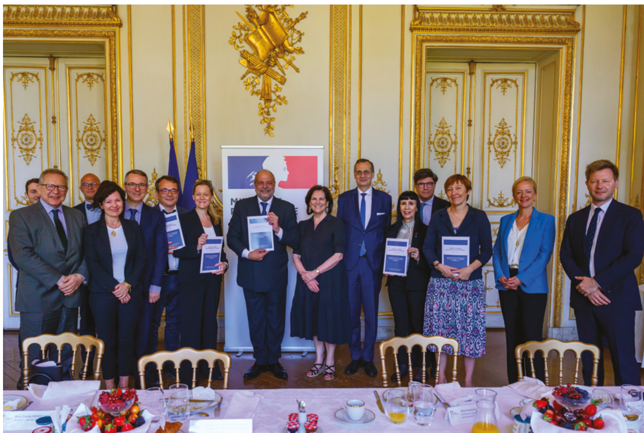
Le 25 juin 2024, les ambassadeurs de l'amiable ont remis leur rapport de mission à Eric Dupond-Moretti, garde des Sceaux, ministre de la Justice.

Enfin, à travers des interventions lors de colloques, de formations et dans le milieu de l'enseignement, la direction des affaires civiles et du sceau poursuit son engagement dans la promotion des modes amiables de règlement des différends et leur appropriation par les professionnels et futurs professionnels du droit.