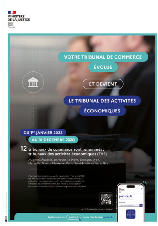
Affiche du TAE