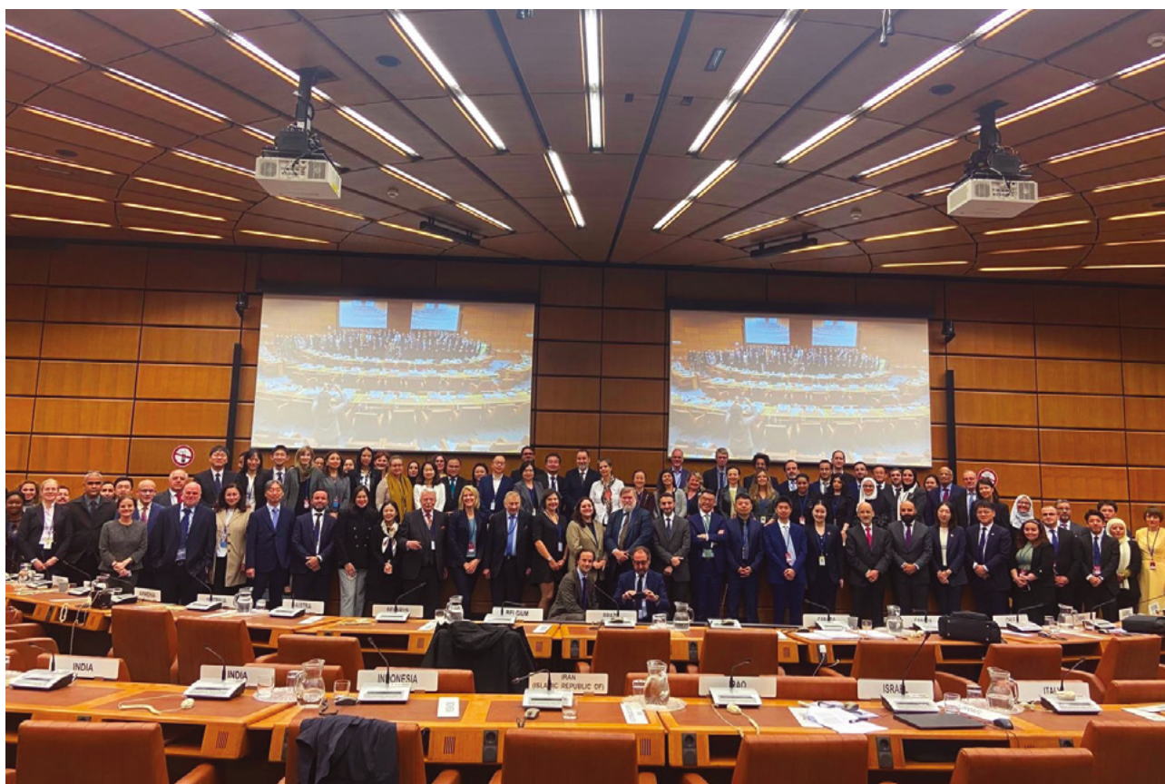
Le groupe de travail II, dédié au règlement des différends, de la Commission des Nations unies pour le droit commercial international (CNUDCI), réuni pour sa 80 e session à Vienne du 30 septembre au 4 octobre 2024.

Les travaux se poursuivent désormais sur l'élaboration d'un guide pour l'incorporation de cette loi-type dans l'ordre interne des États.