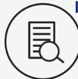
Note attribuée à l'accès de l'information / 10