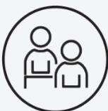
Satisfaction de la qualité de l'accueil