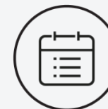
Note attribuée à la prise de rendez-vous / 10