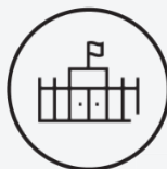
Satisfaction des conditions d'accueil