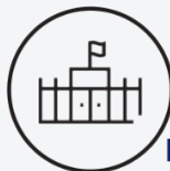
Note attribuée aux conditions d'accueil / 10